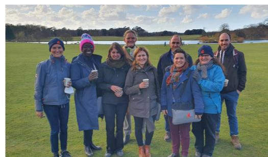
Participation au CSC 2022 au Royaume-Uni